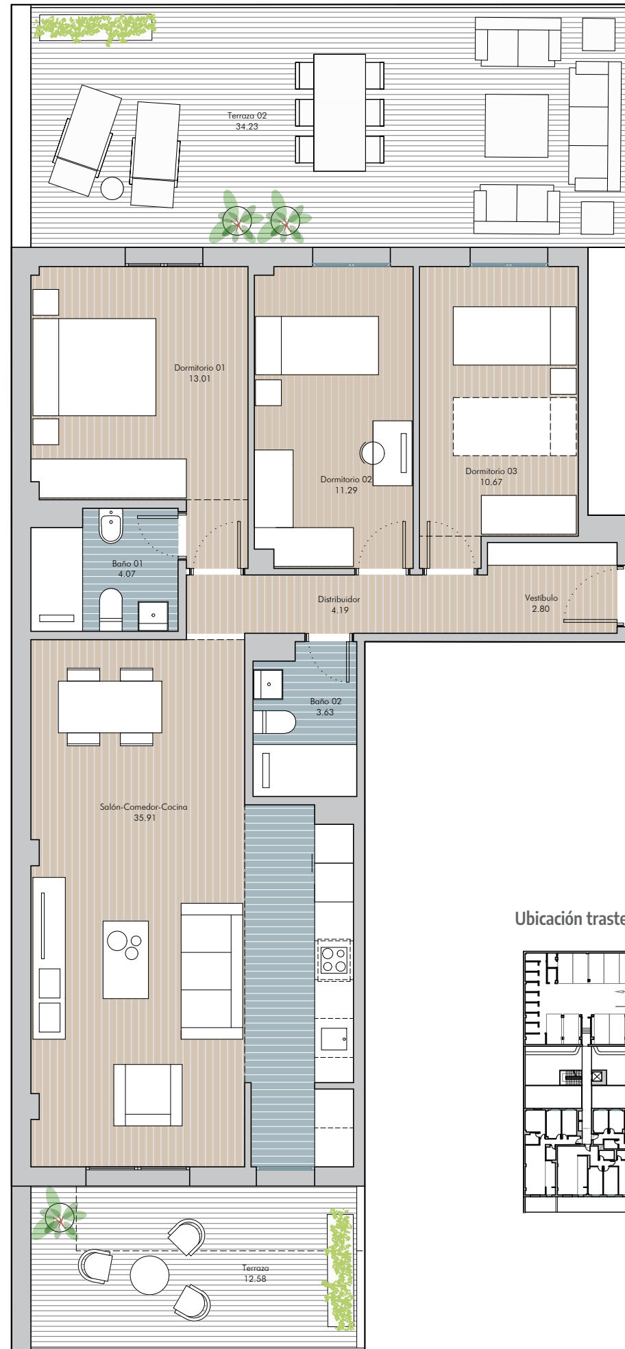
Ubicación trastero y plaza de garaje