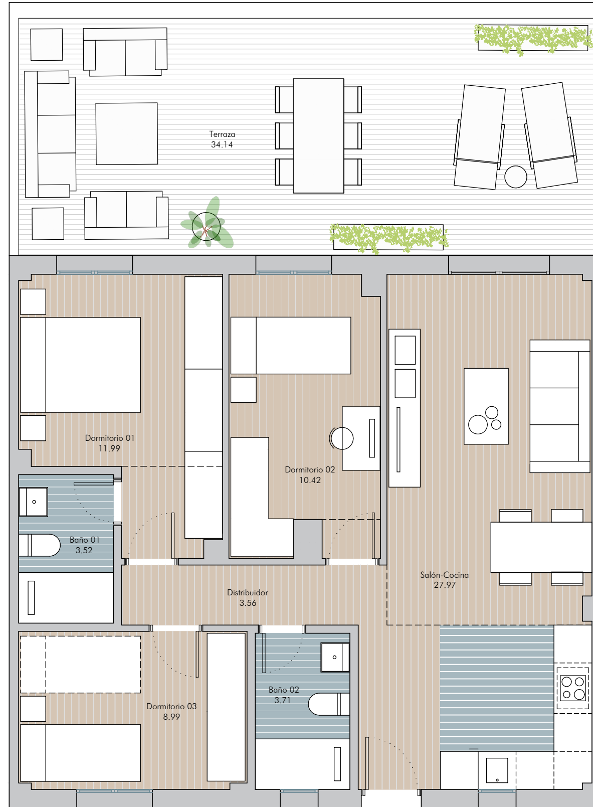
escala gráfica 1:60